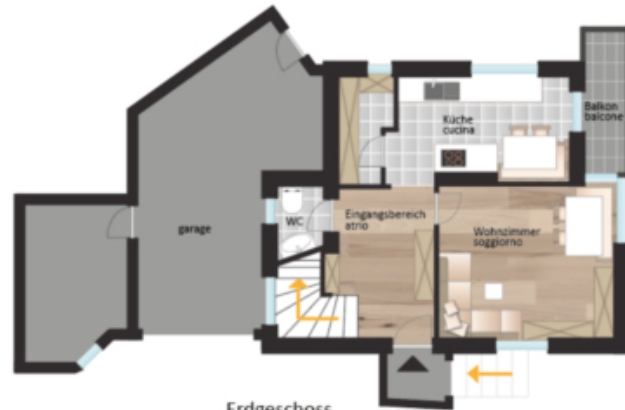
Erdgeschoss piano terra