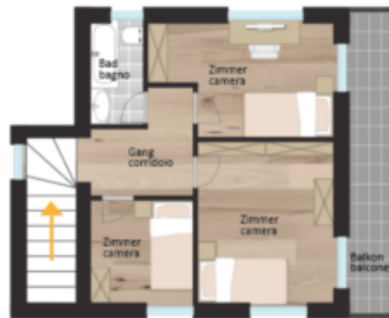
1.Obergeschoss primo piano