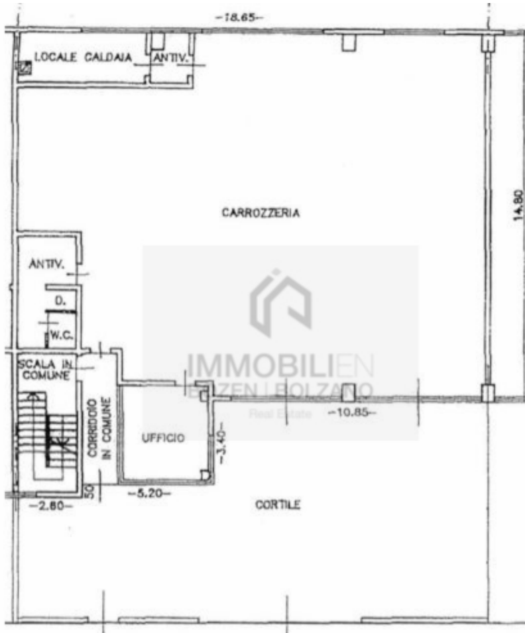
PIANO TERRA H=ml 5.50