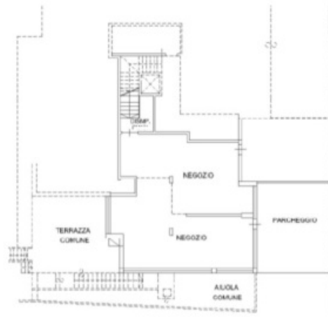
PIANO TERRA ERDGESCHOSS H:320