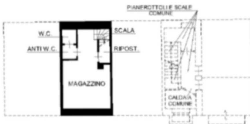
PIANO PRIMO SOTTOSTRADA H=2.70m