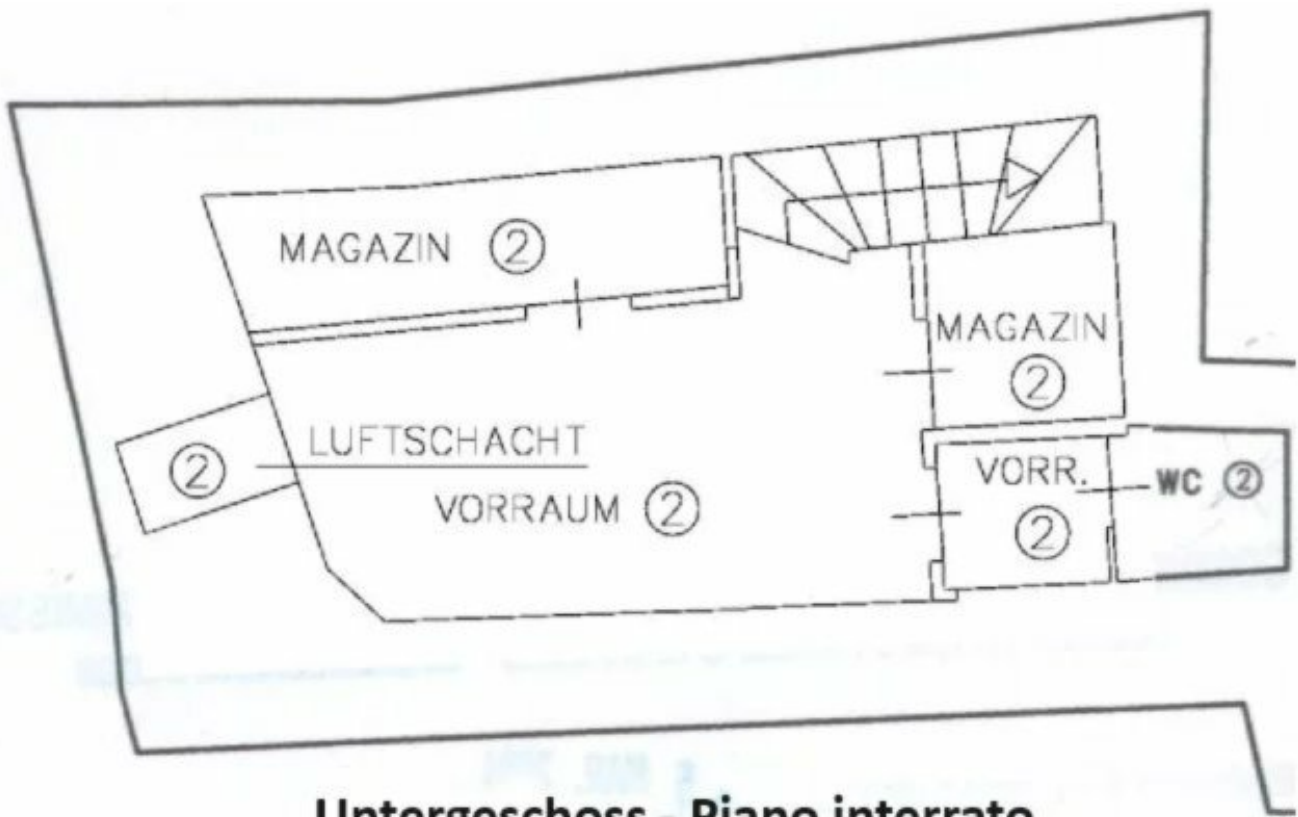
Untergeschoss - Piano interrato