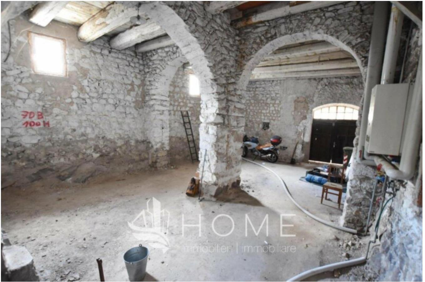
Piano primo - Erster Stock