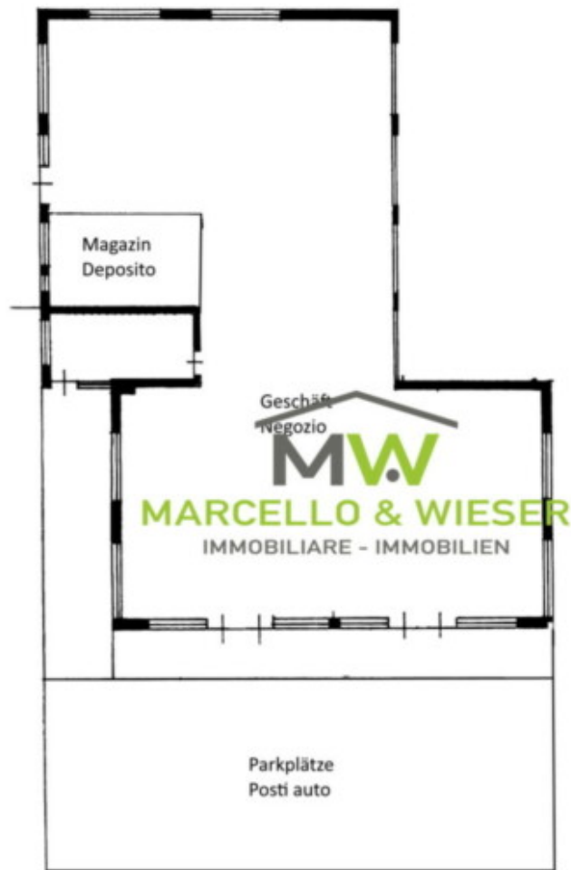
Erdgeschoss Piano Terra