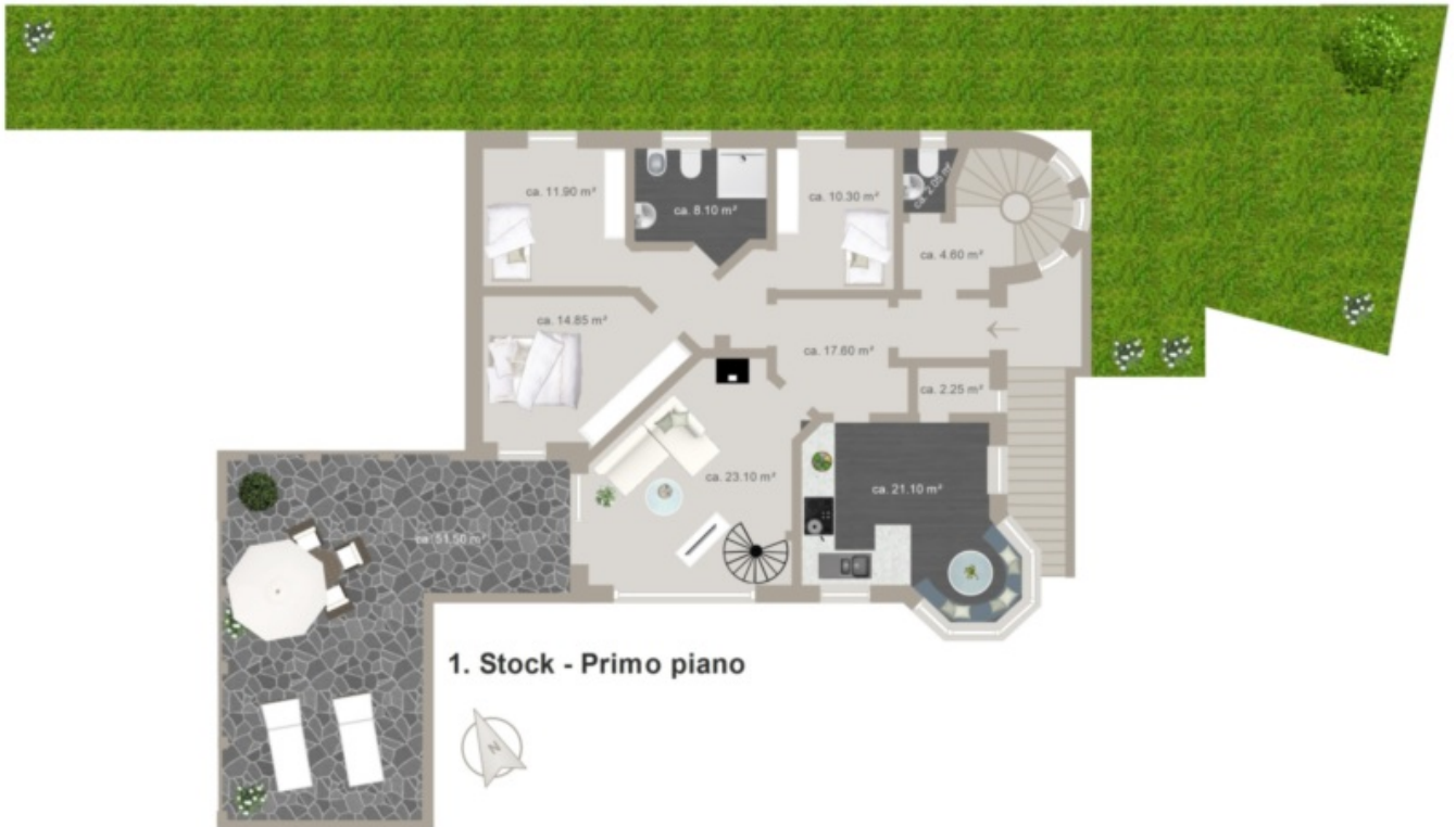
1. Stock - Primo piano