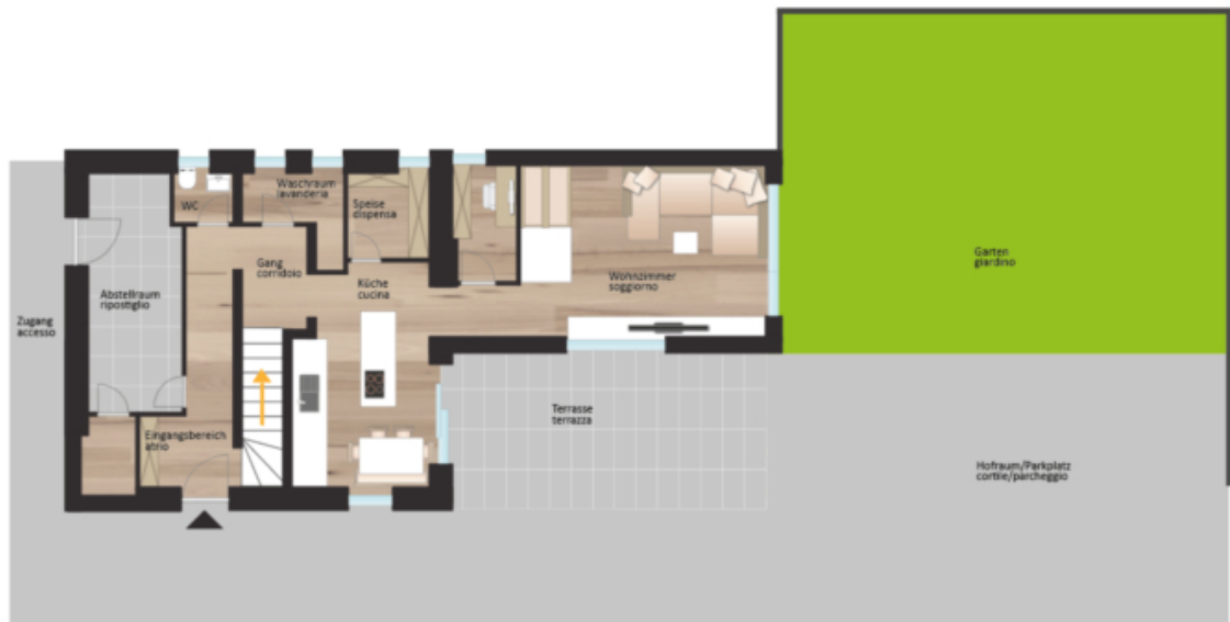
Erdgeschoss piano terra